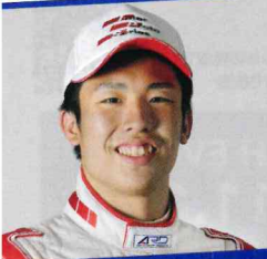
2018年 全日本F3選手権チャンピオン SUPER GT500参戦中 坪井 翔