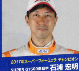
2017年スーパーフォーミュラ チャンピオン SUPER GT500参戦中 石浦 宏明